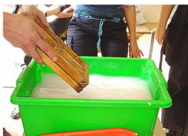
Placer la couverture sur la forme

Prendre le tamis et le cadre, et les positionner l'un sur l'autre. Les plonger ainsi au fond d'un bac, assez large (pas dans un seau). Tenir bien droit, relever et égoutter quelques secondes au dessus du bac. Retirer la couverture (cadre vide). La feuille obtenue doit faire au minimum 3mm d'épaisseur.