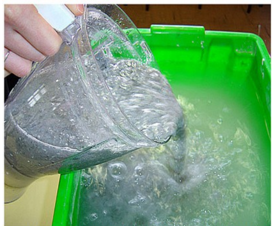
Verser deux bols de papier broyé au déclenchement de l'activité