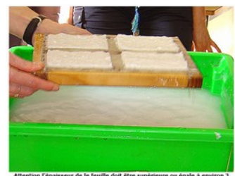
Attention l'épaisseur de la feuille doit être supérieure ou égale à environ 3 mm