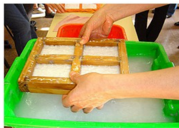
Relever hors de la cuve et laisser égoutter