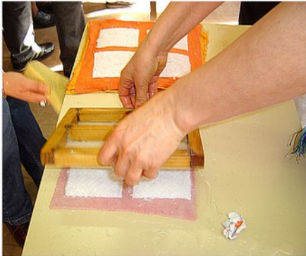
Sans taper, appuyer fortement à plat et relever sur le bord droit

Sur une pile de papier/tissu absorbant, retourner délicatement le tamis et appuyer fortement sur le tissu. Relever délicatement. Recouvrir de tissu et presser entre 2 planches ou 2 livres épais.