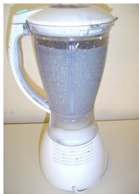
Broyer le papier après avoir complété le bol avec de l'eau